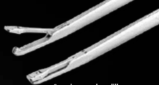
Scorpion para la rodilla AR-12990